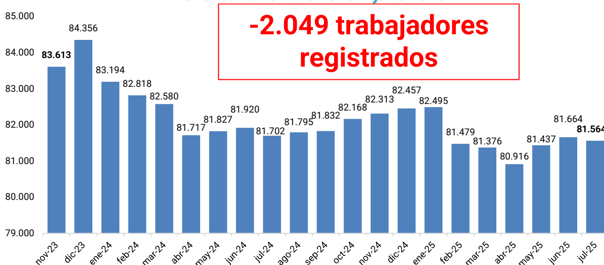
Gráfico 2. Evolución de la cantidad de trabajadores. Período: noviembre 2023 – julio 2025